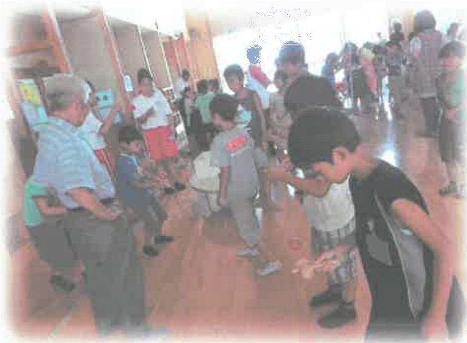
みんなで昔遊び体験