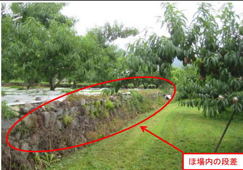
①ほ場内の段差により除草や防除の作業効率が低下している。