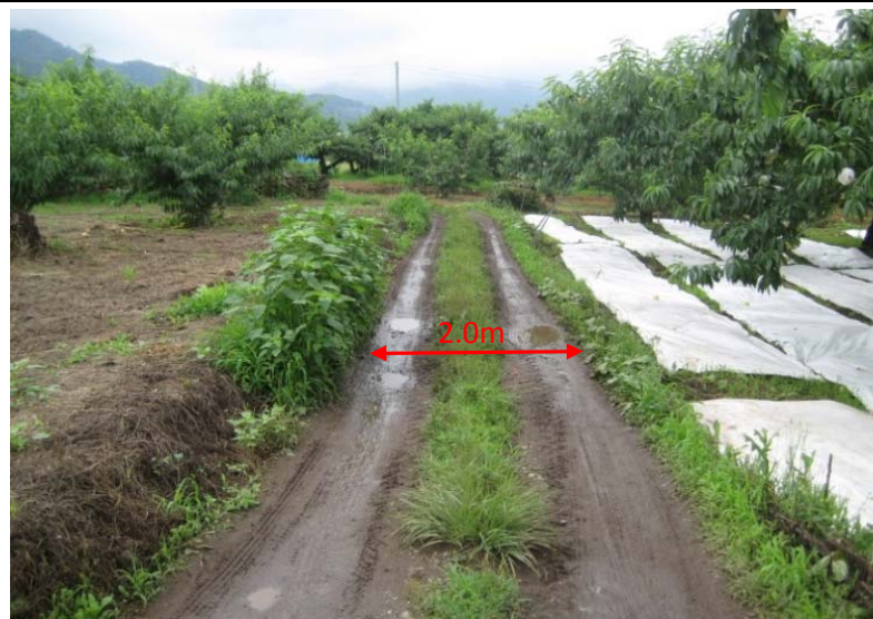
②未整備で狭小な農道が荷痛みの原因となっている。