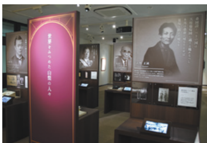
「世界をみつめた山梨の人々」を開催中の人物展示室