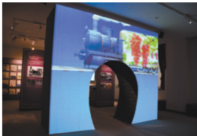
次々と変わる映像で笹子トンネルの歴史を学習