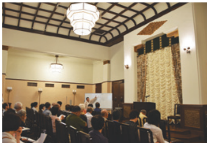
復元した正庁で講座や式典など、さまざまな行事を開催