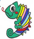
就業支援センター イメージキャラクター "しゅうくん"

FAXで申込の場合は、送信後、確認の電話をお願いします。 FAX・電子申請とあわせ先着順で受講者を決定します。 ただし、受付開始日に申込者が定員を超えた場合は、 この日の申込者全員について抽選で受講者を決定します。 また、受講申込みが少ない場合は、実施しない場合があります。 受付終了後、受講者あてに受講案内(受講決定通知)と 受講料納入通知書(振り込み書)を郵送します。 受講料は、納入期限までに金融機関での納入をお願いします。