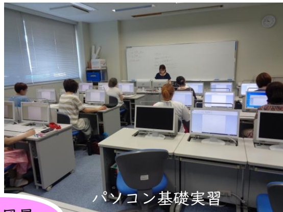
パソコン基礎実習