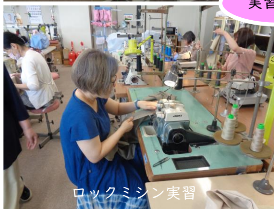
ロックミシン実習