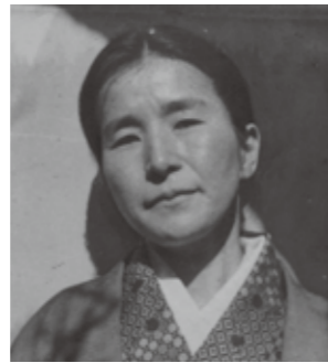
おがわ まさこ 小川正子 (1902-1943)

笛吹市生まれ。ハンセン病患者救済に生涯をささげた医師。瀬戸内海に浮かぶ小島のハンセン病療養所「長島愛生園」で7年間を過ごし、体験記『小島の春』を著した。同著は、のちに映画化され大ロングランとなった。