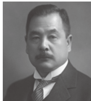
はやかわ のりつぐ 早川徳次 (1881-1942)

笛吹市生まれ。ロンドンで地下鉄事業を学び、東洋初となる地下鉄の“生みの親”となる。生涯を懸けて挑んだ地下鉄は発展を続け、首都の大動脈・東京メトロとして、今も多くのの人々を運んでいる。