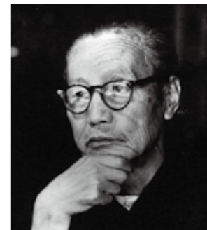
いいただ かつひこ 飯田蛇笏 (1885-1962)

笛吹市生まれ。近代俳句界を代表する俳人。故郷山梨で数々の格調高い句を詠み多くの文化人を魅了した。作家 芥川龍之介とも作品を通して深い交流があった。「芋の露 連山影を 正しうす」は代表句の一つ。