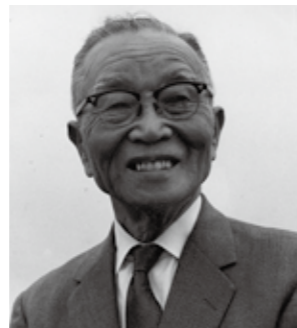
ないとう たちろう 内藤多伸 (1886-1970)

南アルプス市生まれ。建築構造技術者・学者。東京タワー、大阪通天閣、名古屋テレビ塔など、多くの塔を設計し、「耐震構造の父」「塔博士」と呼ばれた。山梨県庁本館や県民会館の設計も手掛けた。