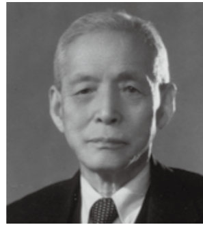
こばやし いちろう 小林一三 (1873-1957)

韮崎市生まれ。阪急グループ創設者で、鉄道を拠点とした都市開発モデルを生み出した。阪急電鉄をはじめ、日本初のターミナル・デパートや東宝映画、宝塚歌劇団など数々の事業を立ち上げた。