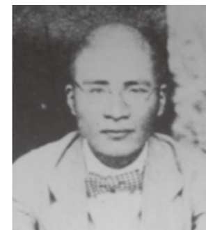
あさかわ たくみ 浅川 巧 (1891-1931)

北杜市生まれ。日本と朝鮮の架け橋となった林業技師。朝鮮半島に渡り、伐採により荒廃した山野の緑化に取り組みながら、朝鮮の工芸品の研究や保存にも尽力するなど、朝鮮文化をこよなく愛した。