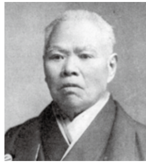
わかおい 逸平 若尾逸平 (1820-1913)

明治時代から戦前までの間、山梨県の発展に貢献した人物、国内外で活躍した山梨県ゆかりの人物