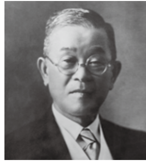
ねづ かいちろう 根津嘉一郎 (1860-1940)

山梨市生まれ。甲州財閥の一人。東武鉄道など全国の鉄道会社経営に関わり「鉄道王」と呼ばれた。文化振興にも大きく貢献し、山梨県内の全小学校にピアノを寄贈。「根津ピアノ」の愛称で、今も親しまれている。