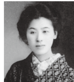
むらおか はなこ 村岡花子 (1893-1968)

甲府市生まれ。モンゴメリの名作を翻訳した『赤毛のアン』など、欧米家庭文学を日本に紹介し、多くの人に夢と希望を与えた。ラジオの子供向けニュース番組に出演したり、童話や随筆、短歌など数多くの作品を世に残すなど、幅広い活動をした。