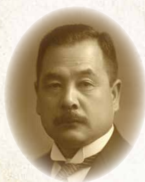
はや かわ のり つぐ 早川 徳次 Noritsugu Hayakawa (笛吹市 1881~1942) 欧米で地下鉄事業を学び、東京地下鉄道を創立。関東大震災を乗り越え、日本最初の路線である浅草・上野間を開業した「地下鉄の父」。