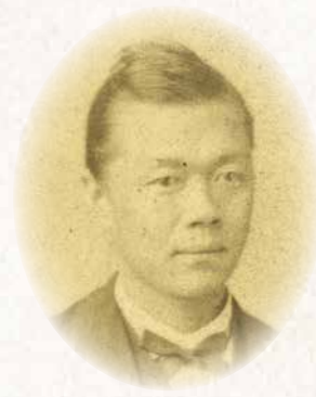
すぎ うら ゆずる 杉浦 譲 Yuzuru Sugiura (甲府市 1835~1877) 甲府勤番出身で、維新後に日本の近代郵便事業をスタートさせた。富岡製糸場の整備に尽力するなど、日本の通信や産業の近代化に大きく貢献した。