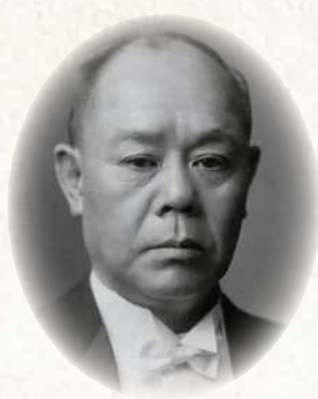
ほり うち りょう へい 堀内 良平 Ryohei Horiuchi (笛吹市 1870~1944) 富士山麓の観光開発を構想し、富士山麓電鉄(現在の富士急行)を実現した。「富士五湖」の名称を広めた人物とも言われている。