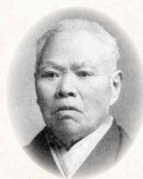
わか お いっ ぺい 若尾 逸平 Ippei Wakao (南アルプス市 1820~1913) 行商生活から一代で、東京の電力や市電を支配するほどの財をなした。政界でも初代甲府市長や、山梨最初の貴族院多額納税者議員に就いている。