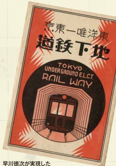
早川徳次が実現した日本初の地下鉄を紹介する「東洋唯一東京地下鉄道絵はがき」 個人蔵