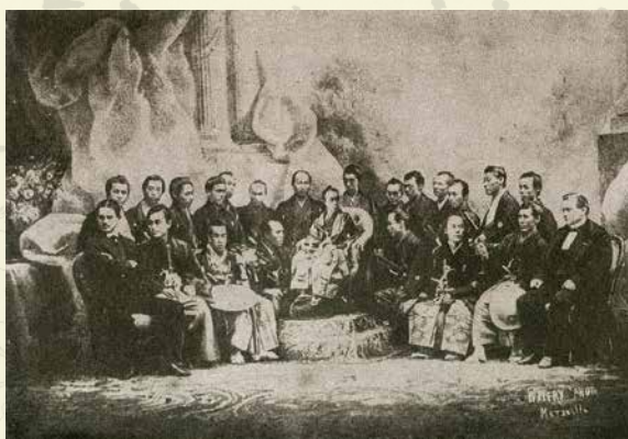
杉浦謙がパリ万国博覧会(1867年)に際して渡仏した際、徳川昭武、渋沢栄一とともにマルセイユで撮影した写真「滋澤榮一滯佛日記」より

江戸から明治へ、新たな時代に向けて激動する社会を舞台に、さまざまな「はじめて」を創造した山梨の人物たちがいました。世の中が大きく変わる時代のなかで、どのような産業や文化が日本に、そして山梨に花開いたのか、その先駆者となった人々の足跡からたどっていきましょう。