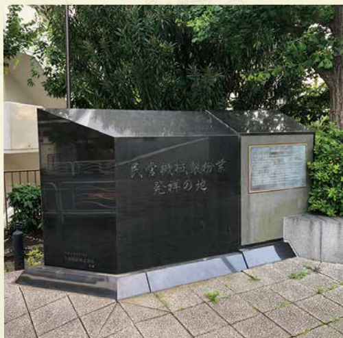
雨宮敬次郎の功績を称える民間機械製粉業発祥の地碑 (東京都江東区)