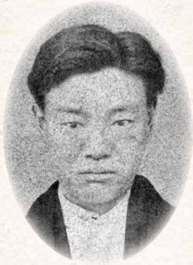
内藤 伝右衛門 Denemon Naito