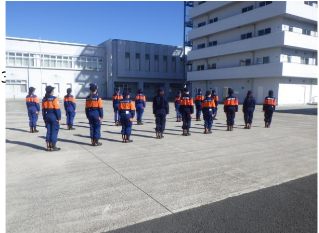
令和4年度特別教育女性消防団員研修の状況