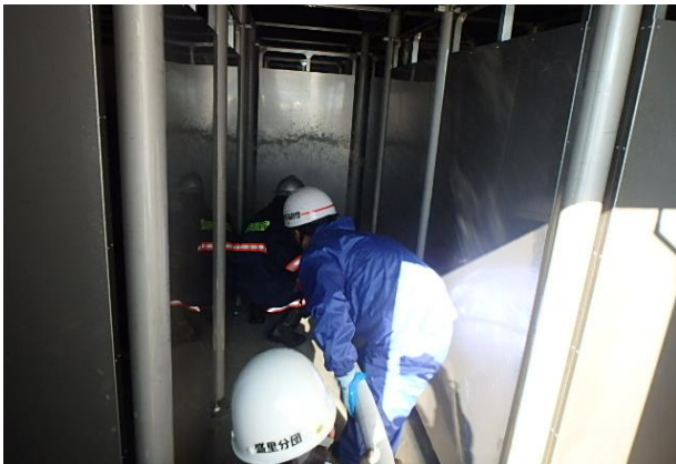
総合訓練棟（1階迷路訓練室）