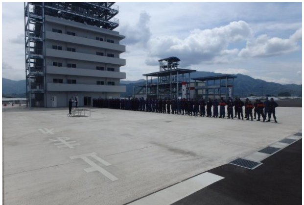
全天候型放水訓練施設