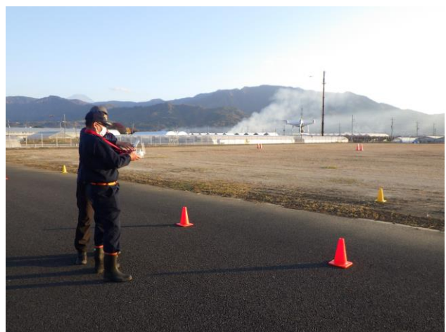
令和4年度特別教育ドローン基礎研修の状況