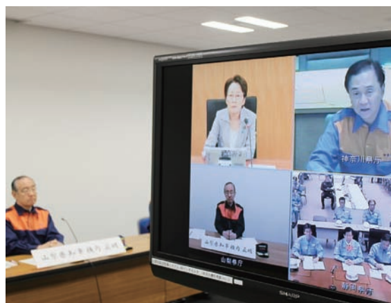
3県と内閣府を結んだ、テレビ会議