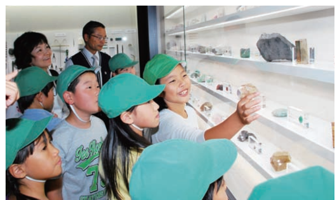
色とりどりの原石が飾られたショーケースに、興味津津な児童たち