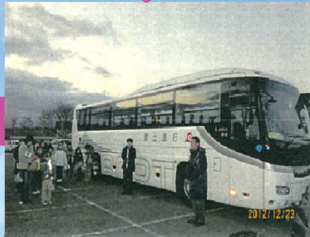
北杜市立高根西小児童が、風船の拾われた工事現場の見学に招かれました。