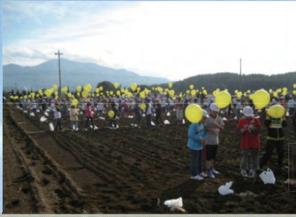
平成24年10月25日、菜の花プロジェクトにおいて北杜市高根町で風船を飛ばしました。