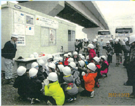
圏央道建設現場の見学をしました。