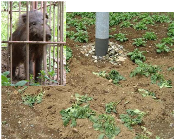
③イノシシによる食害の被害を受けたじゃがいも畑。