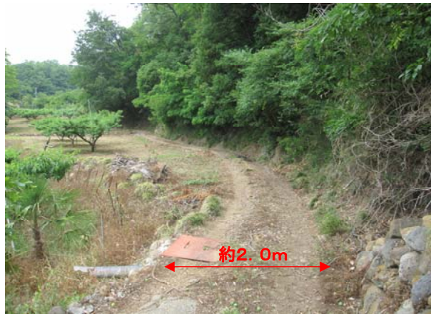
①道路幅が狭小な上、未舗装のため農業資材や農産物の運搬の支障となっている。