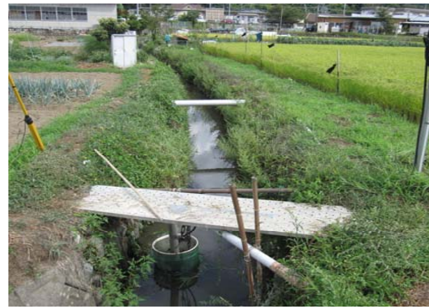
②未整備の農業用排水路。勾配が緩く水が停滞している。