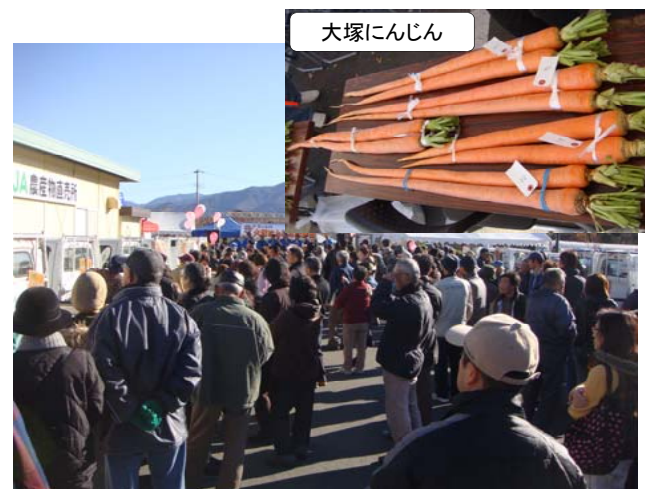
④みたまの湯で開催される「大塚にんじん収穫祭」では県内外から多くの観光客が訪れ賑わいを見せている。