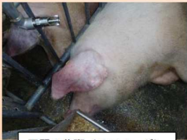
耳翼の紫斑 (チアノーゼ)

発熱、食欲不振、元気消失、うずくまり、便秘に続く下痢、呼吸障害等 異状を発見したら直ちに通報しましょう!