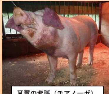
耳翼の紫斑 (チアノーゼ)