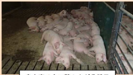
身を寄せ合い積み上がる様子 (パイルアップ)