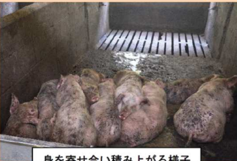
身を寄せ合い積み上がる様子 (パイルアップ)