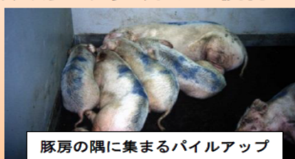
豚房の隅に集まるパイルアップ