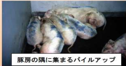
豚房の隅に集まるパイルアップ