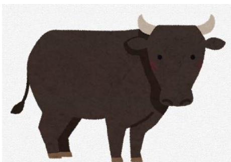
【参考】不正に持ち出され廃棄された受精卵等

不正持ち出しを疑う事例や照会事例がありましたら、家畜保健衛生所までご連絡下さい。