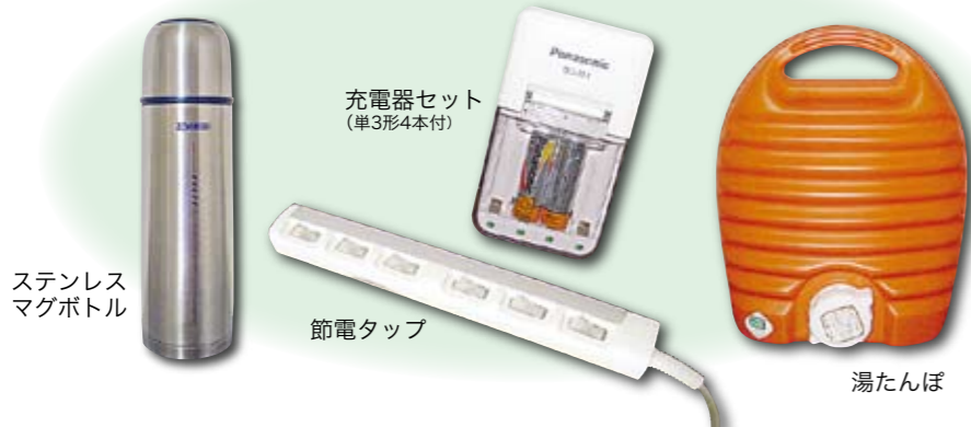
ステンレス マグボトル