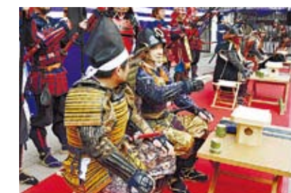
出陣鎧武者との交流ができる陣屋