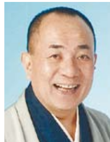
武田信玄公役 三遊亭小遊三さん