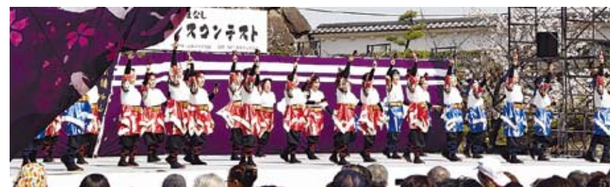
スーパー風林火山パフォーマンスコンテスト