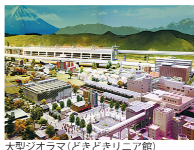
大型ジオラマ(どきどきリニア館)