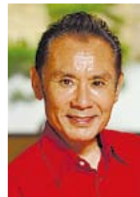
信玄公役 俳優 片岡鶴太郎さん