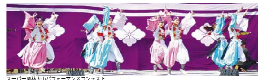
スーパー風林火山パフォーマンスコンテスト

4日 スーパー風林火山パフォーマンスコンテスト 10:30~15:00 特設ステージ 武田信玄や風林火山などを題材にした楽曲・振り付けなどを競う全国大会