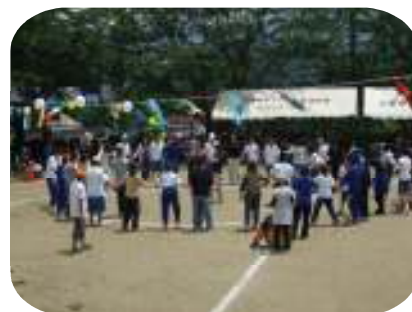
(輪=和を形成しています)