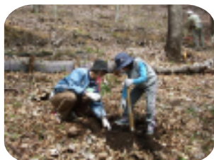
(檜の苗木を協力して・・・)

今回は、「B 苗木を育てよう」と、「E 大きな枝を使って」の2講座が開かれ、1つの斜面では、檜の苗木の植樹と併せ、下草刈りも行われ、また、別の斜面では、ゆったり座れる椅子づくりを目指し、その準備として、枝集めを行いました。