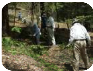
(この枝は、椅子のどの部分に・・・?)

この「シオジ 森の学校」は、11月まで続けられ、夏には、「森のキャンプ」も予定されています。