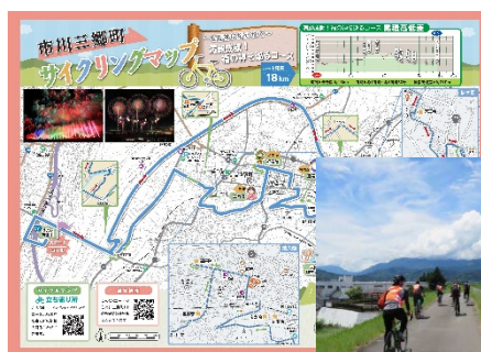
サイクリングマップの作成