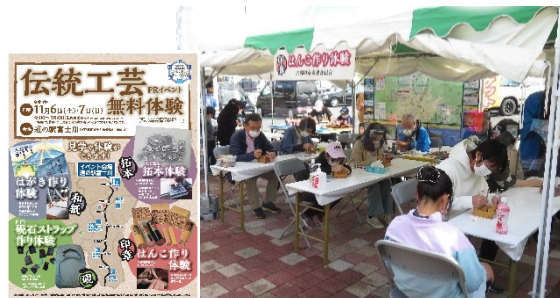
伝統工芸無料体験イベントの実施@道の駅富士川