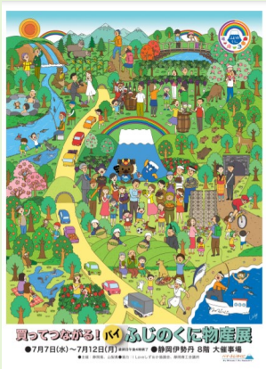
バイ・ふじのくに物産展 (7.7-7.12@静岡伊勢丹)