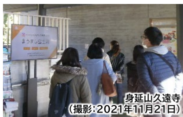
身延山久遠寺 (撮影:2021年11月21日)