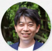
寿司・和食おかめ 代表