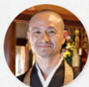
常幸院住職・ 五条ヶ丘活性化 推進委員会会長