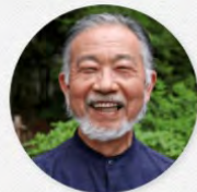
本栖湖 浩庵 代表