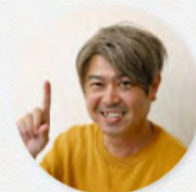
一般社団法人 Mirai 代表