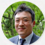
(株)下部ホテル 代表取締役社長