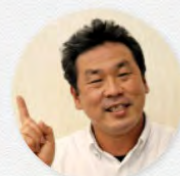
(株)生態計画研究所 早川事業所所長