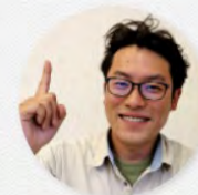
(株)マルゴー 専務取締役