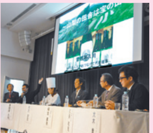
10月27日、やまなし発見フォーラムでは、「やまなしの実り」をテーマに意見が交わされた

今年1月に開幕した「富士の国やまなし国文祭」。全国から訪れた多くの方に、山梨の文化の風と四季折々の魅力に触れていただきました。また、私たち県民は、郷土に息づく文化をあらためて発見し、味わい、大きく育んできました。 11月10日、国文祭はいよいよファイナーレを迎えます。県内各地で開催されるイベントを、心行くまで楽しみましょう。そして1年かけて手に入れた新たな実りを、次代へとつないでゆきましょう。