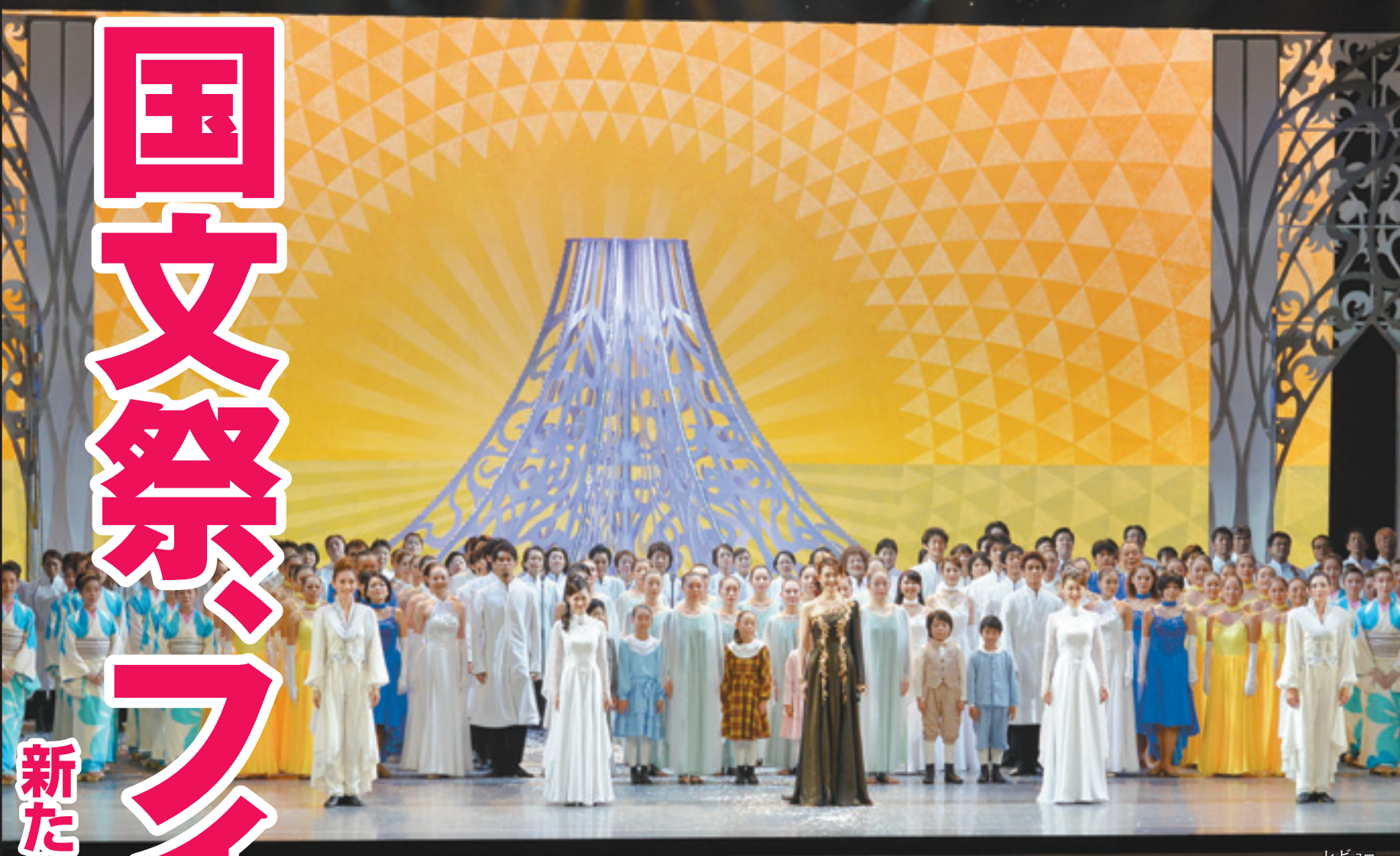
10月26日、総合フェスティバル開会式で上演された宝塚歌劇団演出、OG出演のミュージカル「風の麗美遊」

今年1月に開幕した「富士の国やまなし国文祭」。全国から訪れた多くの方に、山梨の文化の風と四季折々の魅力に触れていただきました。また、私たち県民は、郷土に息づく文化をあらためて発見し、味わい、大きく育んできました。 11月10日、国文祭はいよいよファイナーレを迎えます。県内各地で開催されるイベントを、心行くまで楽しみましょう。そして1年かけて手に入れた新たな実りを、次代へとつないでゆきましょう。