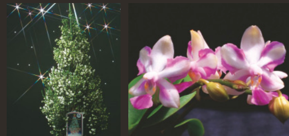
クリスマスエリカ

山梨県は、洋らんやオリジナル品目など、気象条件や技術を生かした特色ある花の栽培が行われ、全国有数の鉢花産地となっています。12月に雪のように白い花をつける「クリスマスエリカ」は、山梨県のオリジナル花きとして人気を集めています。