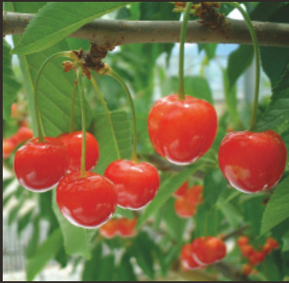
県オリジナル品種: 甲斐オウ果1 (商標: 富士あかね)

赤い宝石のように実る高級感漂う初夏の果物です。山梨県では、5月上旬から観光も取りも楽しめます。「高砂」「佐藤錦」が代表的な品種で、山梨県が栽培の南限と言われています。県オリジナル品種として、「甲斐オウ果1 (商標: 富士あかね)」があります。