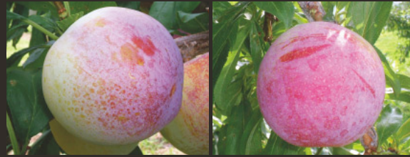
県オリジナル品種: サマービュート

栽培面積、生産量ともに日本一です。「大石早生」や「太陽」、果肉が赤い「ソルダム」の他、スモモの常識を覆すほど大玉で高糖度の「貴陽」や、県オリジナル品種の「サマービュート」「サマーエンジェル」が注目されています。