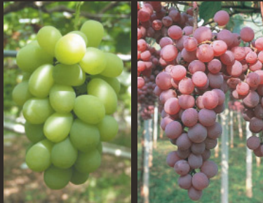
ロザリオ ピアッコ

栽培面積、生産量ともに日本一です。栽培の歴史は古く、山梨県では約1300年前から始まったと言われています。「巨峰」「ピオーネ」「甲斐路」「ロザリオ ピアッコ」など、品種はとても豊富です。また、「甲州」はワイン用としても有名な本県独自の品種です。