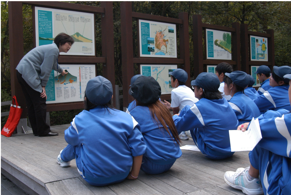
山梨県環境科学研究所での環境学習

小学校中・高学年以上では、環境を客観的に認識し、概念的に理解する能力が育まれてくるため、自然の仕組みや自分たちの生活と環境との関わりを理解させ、問題解決能力の育成を図ることが可能となります。