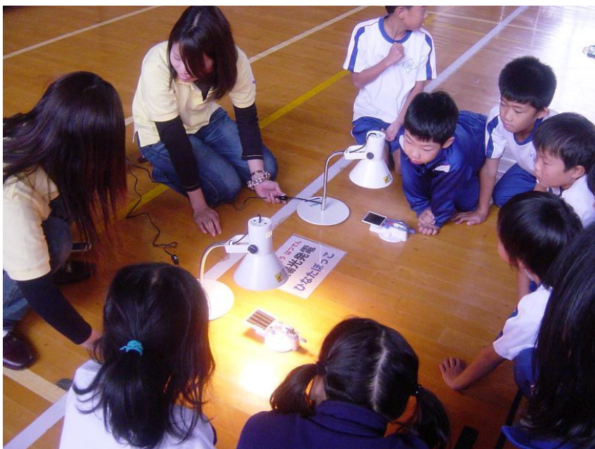
自然エネルギーの学習

「ゆめソーラー館やまなし」は、太陽光発電の仕組みや二酸化炭素排出削減効果の説明など、太陽光発電をはじめとする再生可能エネルギーなどに関する展示を行っています。また、米倉山太陽光発電所構内には太陽光パネルを見学できる遊歩道を整備しており、環境学習の場を提供しています。