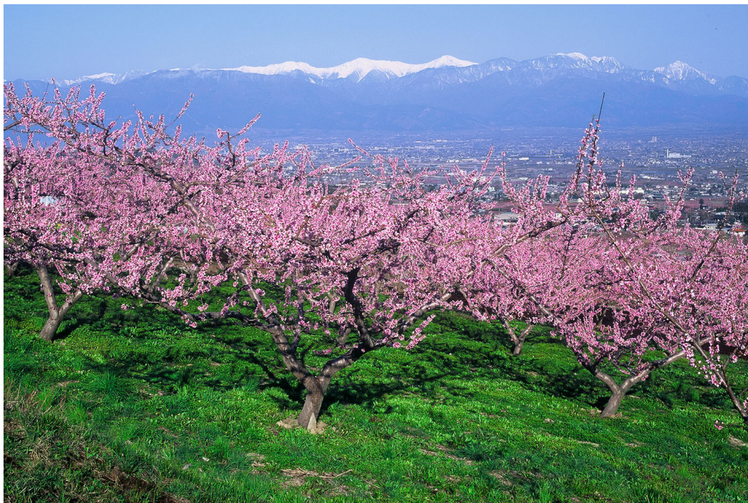
山梨の美しい景観（桃の花と南アルプス）

こうした取組みを通じて、ファシリテーターやコーディネーターなど連携のための人材育成にも寄与していきます。