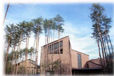
山梨県環境科学研究所