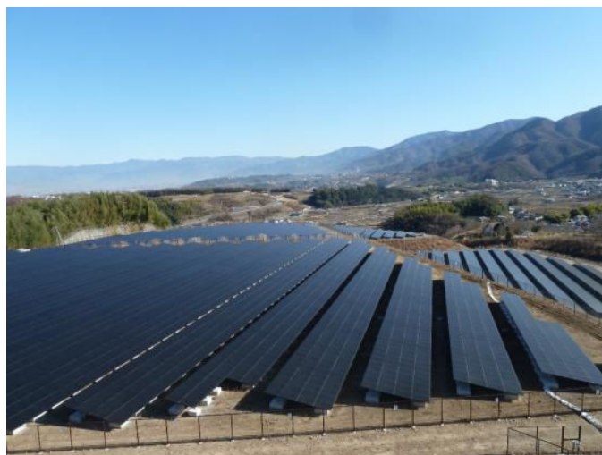
米倉山太陽光発電所

また、本県は平成24年1月に「富士の国やまなし次世代エネルギーパーク」として国から認定を受けており、本県の豊富なクリーンエネルギー資源と活用技術を県内外にPRするとともに、クリーンエネルギーへの理解を図るため、クリーンエネルギー施設と周遊ルートを広報していきます。