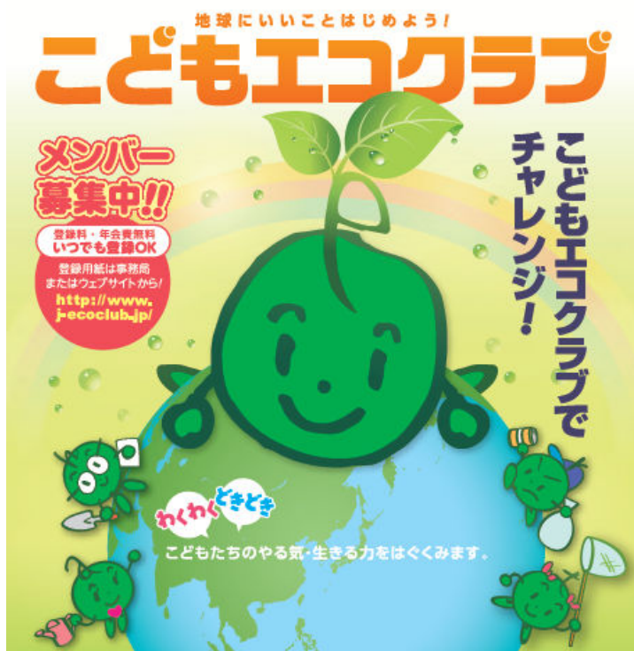
こどもエコクラブパンフレット

ユネスコ憲章に示されたユネスコの理想を実現するため、平和や国際的な連携を実践する学校です。政府ではユネスコ・スクールをESD（持続発展教育）の推進拠点と位置づけ、その増加を図っています。平成24（2012）年12月現在、国内では550校、世界では約9,000校が登録され、環境教育や国際理解教育に取り組みながら国内外の登録校と交流しています。県内では、かおり幼稚園、南アルプス市立芦安小学校、南アルプス市立芦安中学校、山梨英和中学校・高等学校が登録しています。