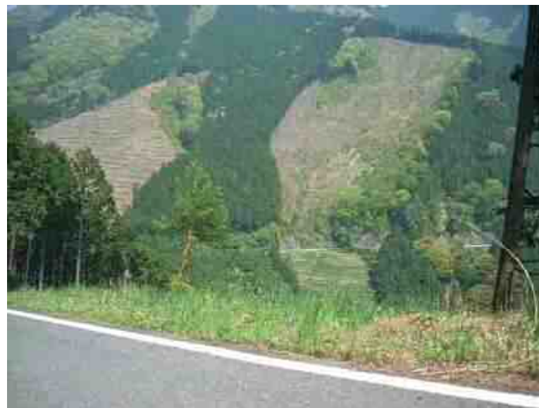
林道沿線の森林施業状況