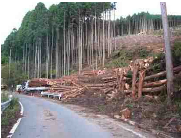
林道沿線の主伐状況