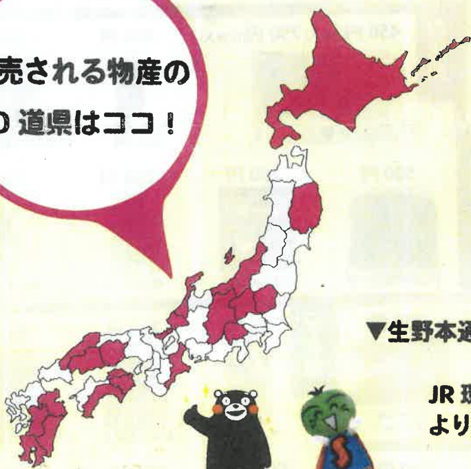
協力 熊本県大阪事務所 すだちくん 徳島県マスコット