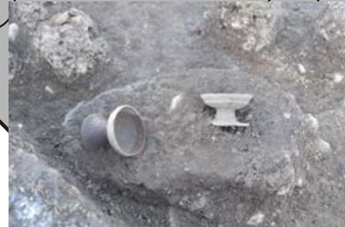
この高環で何を盛り付けたのかな？

調査では古墳時代と平安時代の竪穴建物の跡が発見され、中からたくさんの土器が出土しています。古墳時代の竪穴建物跡の中には1辺が10m程度の大形のものもみつかりました。