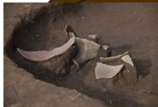
割れた壺の破片だよ！

これまでの調査で縄文時代から中世までの幅広い時代にわたった遺跡であることがわかってきた美通遺跡。今回の調査では、縄文人が調理をしたと考えられる、たくさんの石を熱した跡や、直径1mくらいの穴に1点だけ横たわっていた弥生時代の壺などが発見されました。