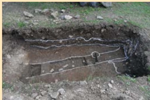
石を運び出した道かな？

史跡甲府城跡とともに国史跡に指定されている愛宕山石切場跡は、甲府城跡から南東へ、直線距離で約300m離れた愛宕山のふもとに位置しています。史跡内には大きな池があり、この池を中心に石垣の材料となる安山岩を切り出していたと推定されています。