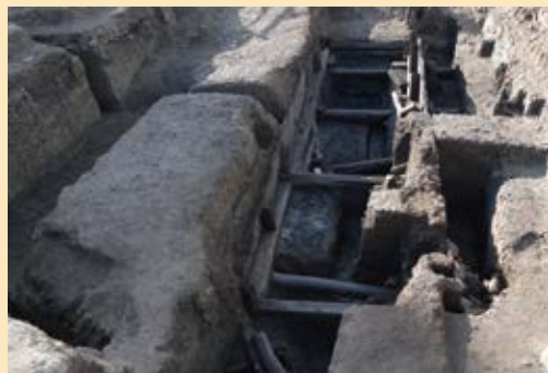
なぞの木造構造物現る！？