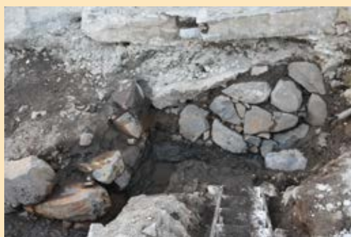
写真左側が腰石垣、正面が一の堀の石垣です！

またこの腰石垣は、江戸時代中頃の絵図に描かれており、調査によって存在が証明されました。