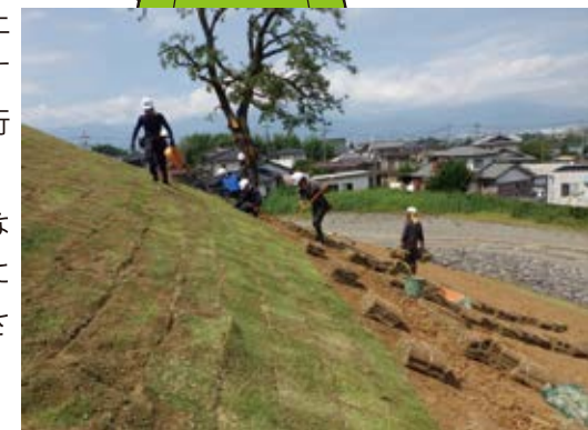
きれいになりますように…

今回の整備では、墳丘に生えていた樹木が成長して、日陰となった部分の芝が枯れ、雨水によって墳丘の土が流れてしまった地点の復旧を行いました。また、経年劣化により玉砂利敷きが減ってしまった階段に碎石を入れ直す工事と後円部墳頂部の擬木柵が倒れないように植生土嚢で養生する工事を行いました。きれいになった古墳に来てください！