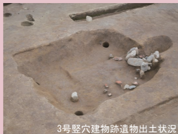
3号竪穴建物跡遺物出土状況

平安時代の人々は、地面を方形に掘り込み、柱を立てて屋根を葺く竪穴建物跡に暮らした。新町前遺跡では、10世紀～11世紀にかけて、43軒の竪穴建物跡が見つかった。