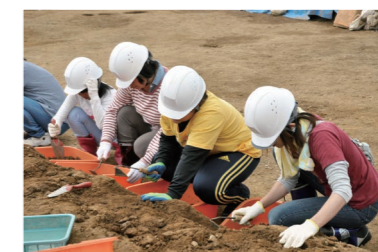
左：発掘体験セミナーのようす 下：現地説明会のようす

埋蔵文化財センターでは、「発掘体験セミナー」や「現地説明会」などのイベントを実施しています。新町前遺跡では、埋蔵文化財に対する理解と地域の歴史への興味・関心の促進のため、10月～12月に毎月1回ずつ、発掘体験セミナーと現地説明会を実施し、現地説明会では、延べ287名の参加がありました。現地説明会にたくさんの人が参加してくれたことは、地域の歴史に対する関心の高さであり、私たち職員もうれしく思います。今回の発掘調査の成果を、地域の歴史を積み上げていく一つの材料として、地域の価値を高め、守り、次世代へ引き継いでいってください。