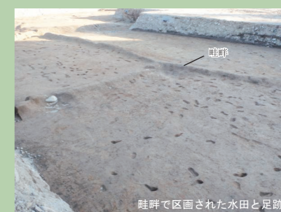
畦畔で区画された水田と足跡

新町前遺跡では、畦畔で区画された水田が15枚見つかった。水田の耕作土から出土した土器の年代から、15世紀頃に営農されたものである。