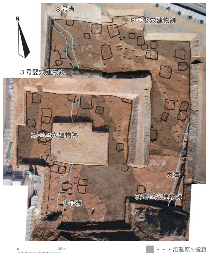
平安時代の遺構検出状況（上空から）