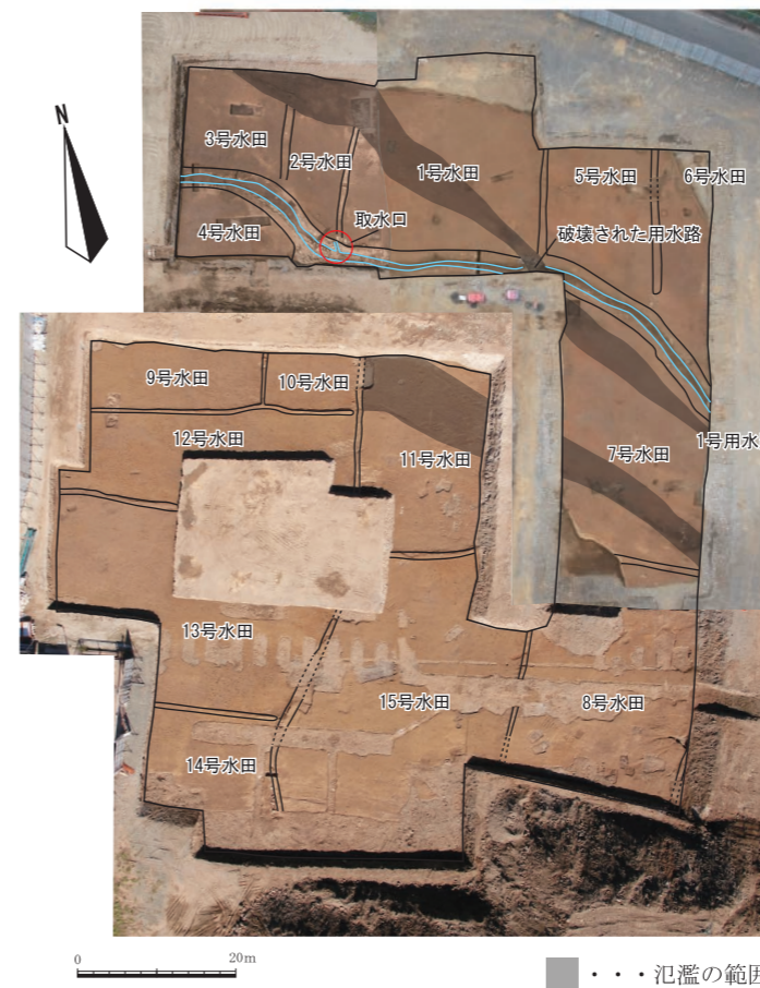
中世の水田検出状況（上空から）