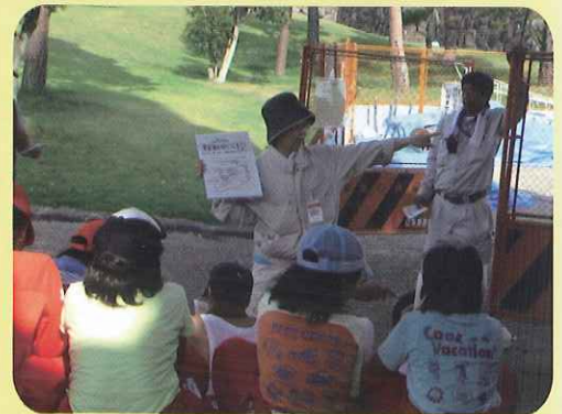
交代で甲府城のお勉強

記録的な猛暑の中、顔を真っ赤にしながら一生懸命取り組んだ結果、石垣はすっかりきれいになりました。甲府城の勉強をしたり、汗を流して落書き消しを行うことで、子供たちも甲府城の価値や文化財の大切さを学んだことでしょう。