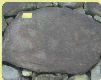
こんなに上手に消せました