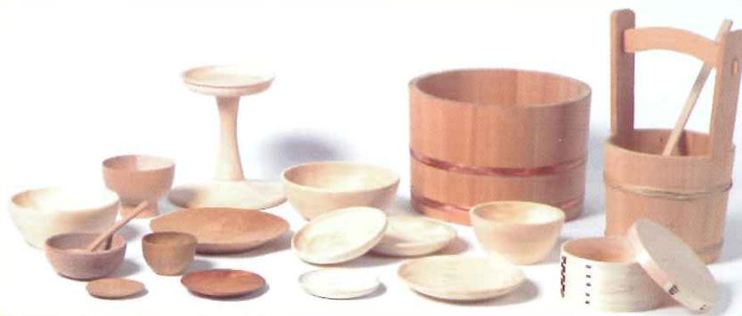
木製品は復元品を貸し出ししています 時代によって変わる器の形や製作技法を再現しています