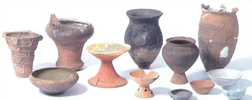
土器は実際に遺跡から出土したものを貸し出ししています

また、土器づくりや火起こしの方法、遺跡の発掘体験記などを収録したDVDをご用意しています。各体験の事前学習や考古資料の貸し出しとあわせてご利用ください。