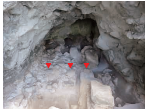
土砂を全て取り除いた大土窟。礎石列や横穴が確認できる。(▼印部分が礎石)