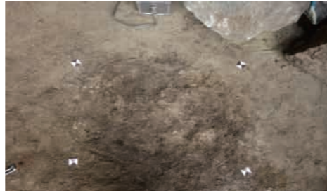
護摩焚きの跡と考えられている焼土

——— 隼遺跡は現地で保存される方向で検討されています。今後の方向性について、考えを聞かせてください。