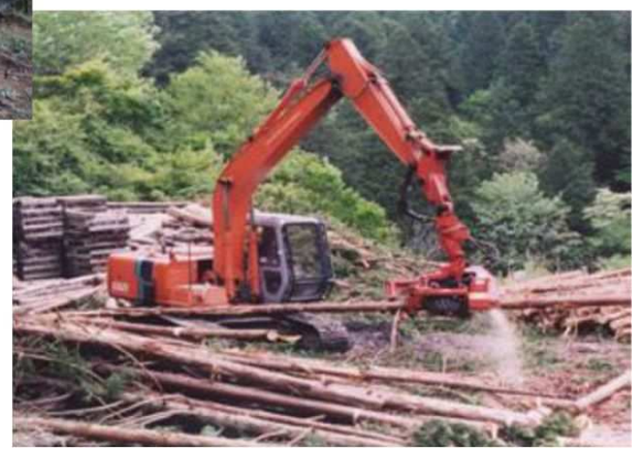
○中間土場への収集 (効率的な仕分けとロットの確保)