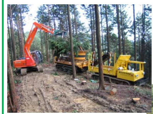
○移動式チッパー機導入 (チップ化により運搬コストの軽減)