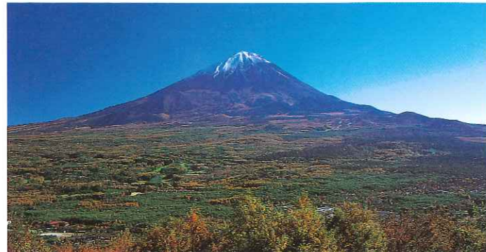
紅葉台からの青木ヶ原樹海

■青木ヶ原樹海/精進湖登山道に沿う大原始林でその規模は日本一です。樹海内には水穴、風穴、西湖コウモリ穴等の天然記念物の岩溶洞窟があります。