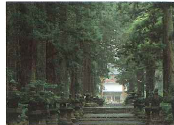
北口本宮富士浅間神社

■忍野八海/20年以上かかって流れ出る富士山からの伏流水に水源を発するといわれる8つの湧水池。名水百選のひとつです。