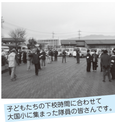
子どもたちの下校時間に合わせて大国小に集まった隊員の皆さんです。