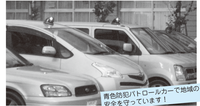
青色防犯パトロールカーで地域の安全を守っています!

役員や運営委員のほか、玉諸小の校長先生やPTAも、受講者や同乗者としてこの取組に協力して、パトロールを実施しています。