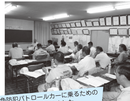
青色防犯パトロールカーに乗るための県警による講習を受けました。

パトロールは週1回のペースで、夜8時に玉諸駐在所から出発し、1時間かけて区内を巡回しています。県警に登録した11台の車両を2班に分けて、区内内隅々までパトロールが行えるようにしています。また、駐在所に集合することにより、参加者の安全・安心への意識も高められています。