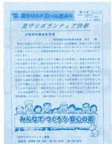
パトロールだより

兵道会長さんの「この子達が大きくなって、大人になったら地域の子ども達を守るようになってくれるのが夢です」との言葉に、自主防犯ボランティア活動を継続していくことの困難さや大切さが表現されていると感じました。