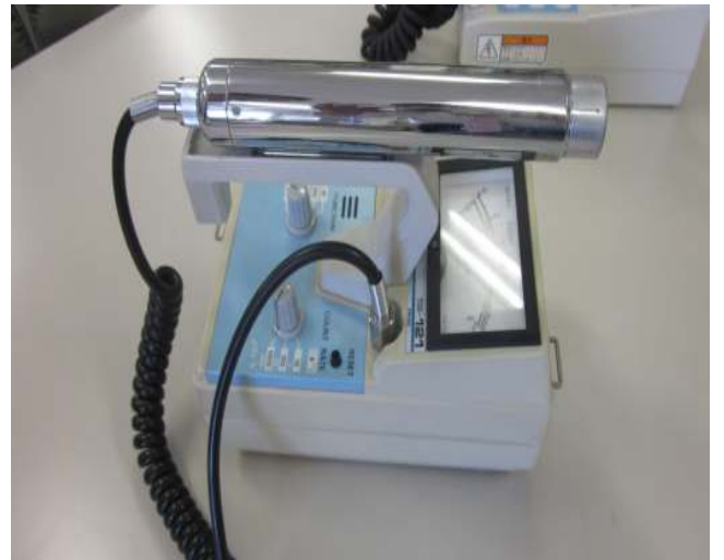
GM サーベイメーター