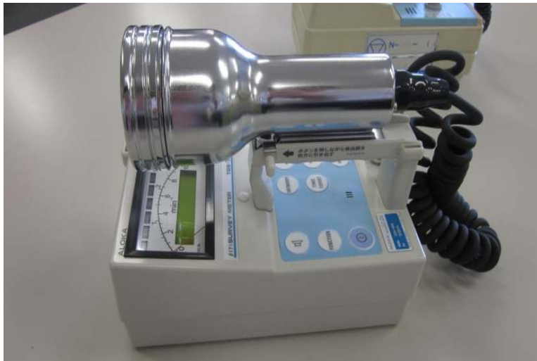
GM サーベイメーター