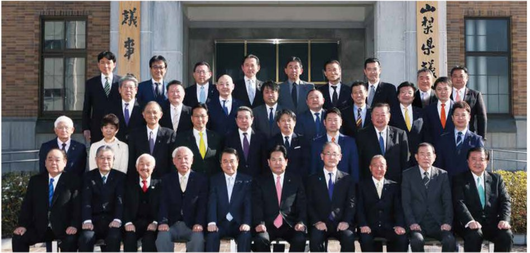
令和3年1月13日 県議会議事堂前