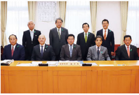
土木森林環境委員会