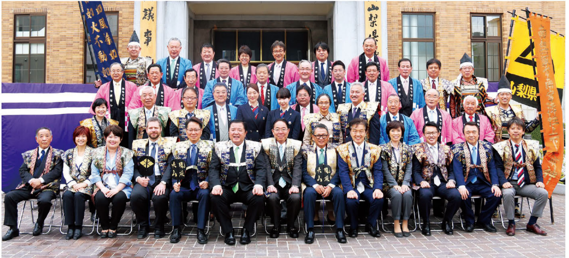
4月7日に開催された第47回信玄公祭りでは、昨年に引き続き県議会おもてなしサロンを開催し、県内外からの来訪者をおもてなしました。