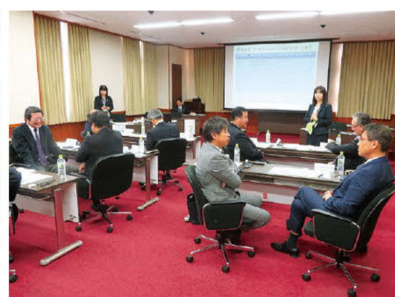
研修会での傾聴疑似体験

【自殺対策議員連盟研究委員会】 自殺の兆候に気付いて相談・支援につなげる「ゲートキーパー」の養成研修を委員が受講し、県精神保健福祉センターからゲートキーパーに認定されました。