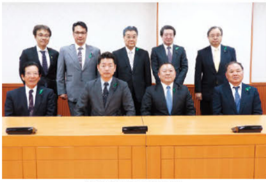
農政産業観光委員会