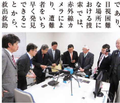
ドローンを用いた研究の調査

総務、教育厚生、農政産業観光及び土木森林環境の四常任委員会は、三月二日に平成二十九年度補正予算案等の、三月七日～九日には平成三十年当初予算案等の審査を行いました。平成三十年当初予算案等の審査では、委員会の分散開催を試行し、一般傍聴者とともに多くの議員が傍聴しました。また、予算特別委員会から調査を依頼された議案について、三月十四日の予算特別委員会で、審査の内容及び審査結果を各常任委員長が報告しました。