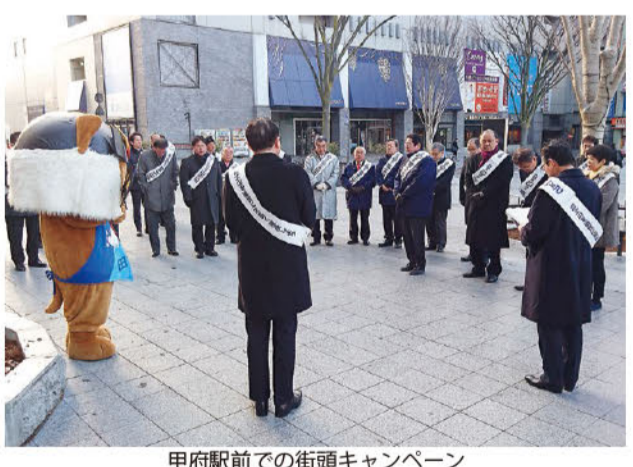
甲府駅前での街頭キャンペーン

県民に広く「富士山の日」をアピールするとともに、富士山の保全に向けた機運をさらに促進させるため、二月二十三日、甲府駅前等において街頭キャンペーンを行いました。