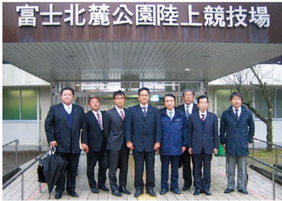
富士北麓公園陸上競技場