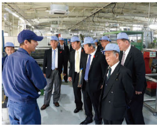
県内製造業の現場調査

答 近年、緩やかな景気の回復傾向が続く中、経営支援的な融資の実績が落ちている。そのため、現在の小規模企業の経営サポートを中心とする融資だけでなく、新たな設備投資や、起業・創業、事業継承、新分野進出といった前向きな資金需要にまで保証料補助の対象を拡充することで、利用者である県内中小企業者の負担を軽減し、積極的な事業展開を後押ししていく。