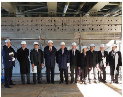
橋梁長寿命化工事を調査

【その他の主な質問事項】 ・生活困窮者自立支援事業費 ・医師確保対策費 ・アレルギー疾患対策事業費 ・教育振興基本計画策定費 ・学向上総合対策事業費