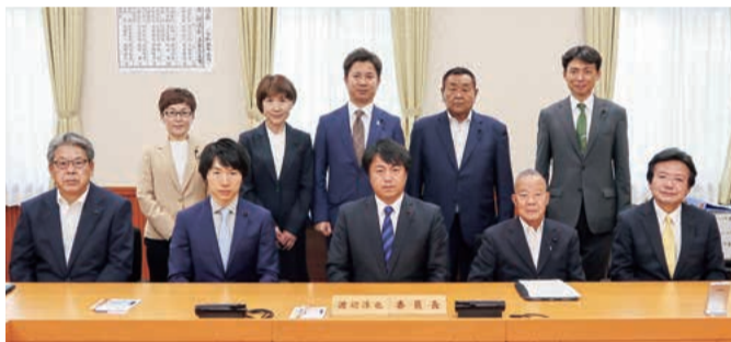
地域の医療と介護を守るための条例案作成委員会