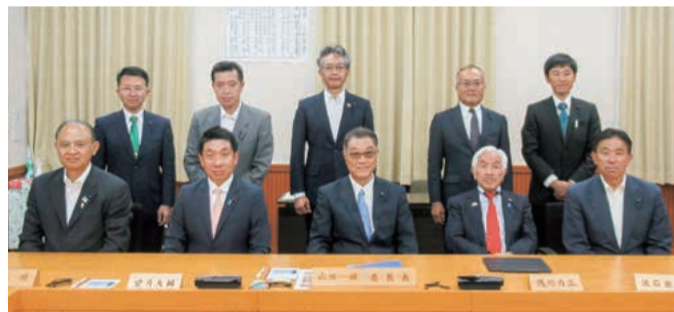
やまなし子供の貧困対策の推進に関する政策提言案作成委員会

指定管理施設の管理の業務又は経理の状況及び県が出資している法人の経営状況を調査する指定管理施設・出資法人調査特別委員会を七月六日の本会議において設置しました。 調査の対象は、四十四の指定管理施設と県が資本金等の四分の一以上を出資している二十九法人です。 同委員会は閉会中も該当施設・法人の審査や現地調査などを継続して行い、その結果を九月定例会に報告する予定です。