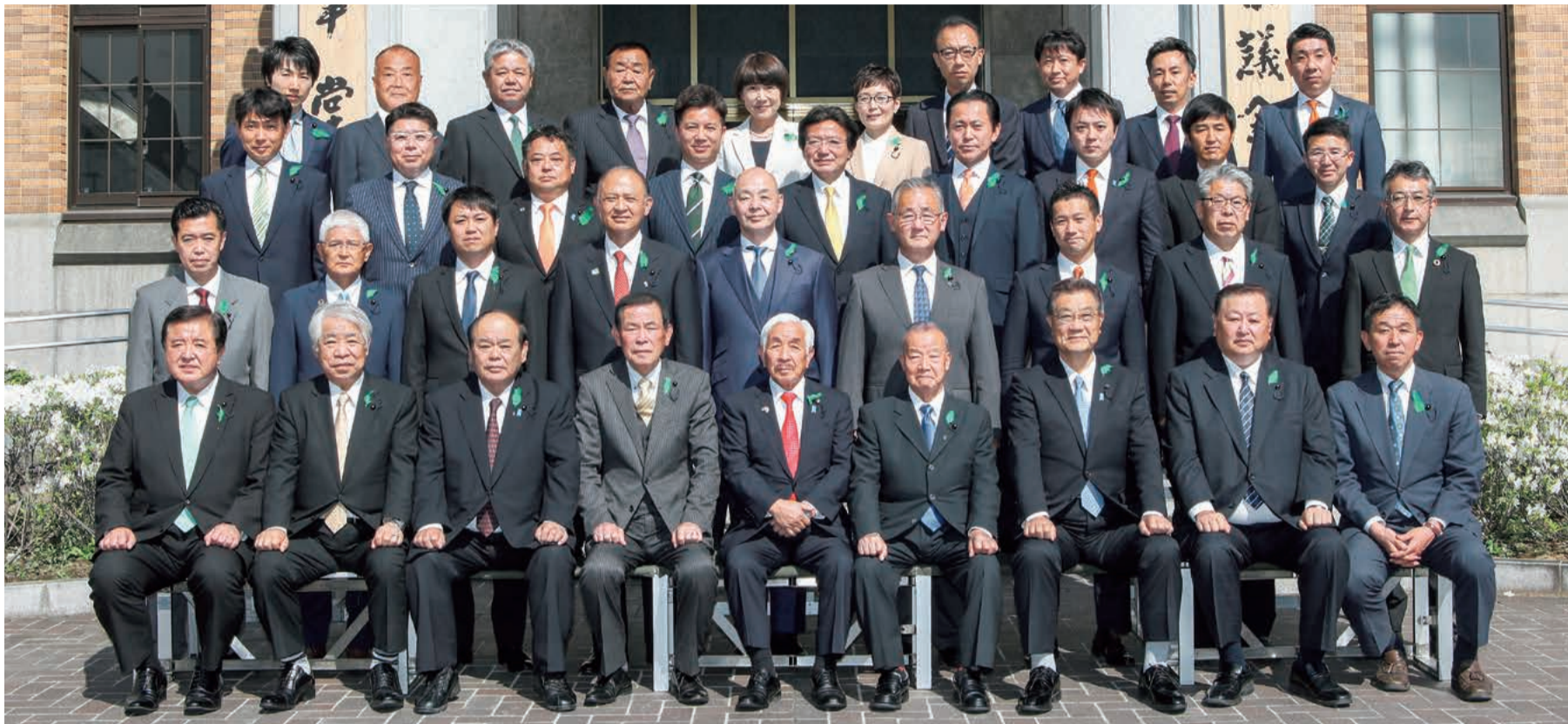
令和5年5月1日 初登庁日 県議会議事堂前