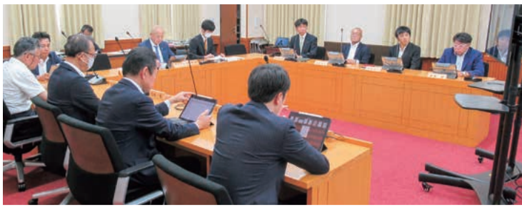
デジタル化推進委員会