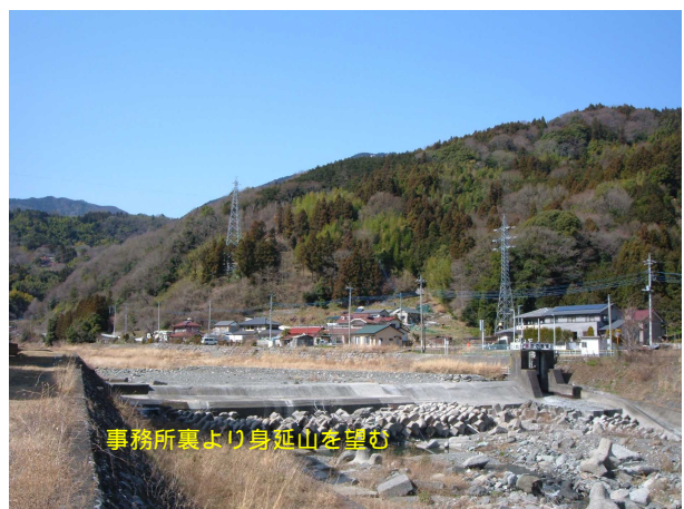
事務所裏より身延山を望む