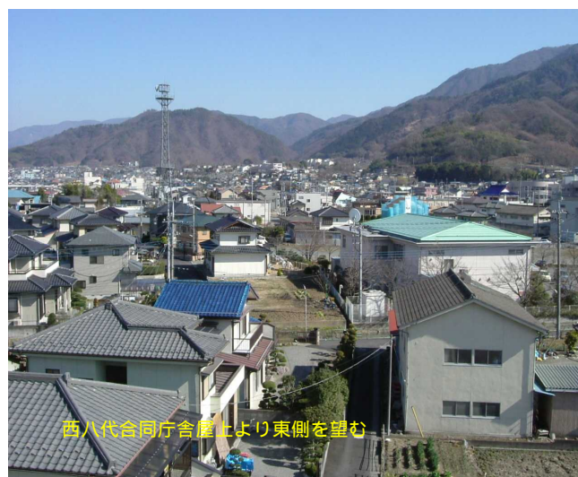
西八代合同庁舎屋上より東側を望む