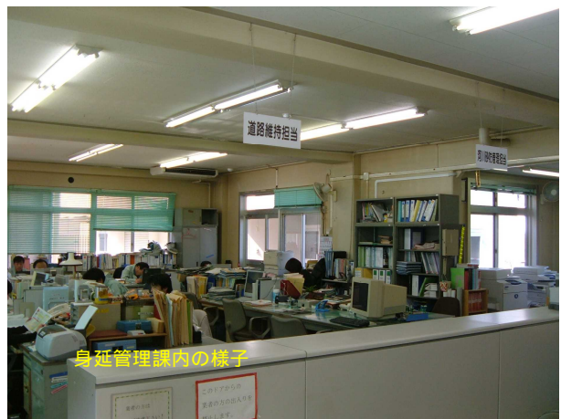
身延管理課内の様子