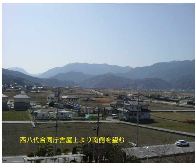
西八代合同庁舎屋上より南側を望む