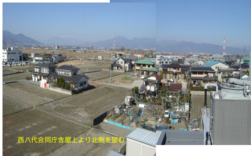
西八代合同庁舎屋上より北側を望む