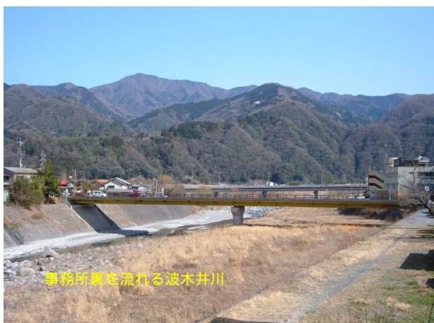
事務所裏を流れる波木井川