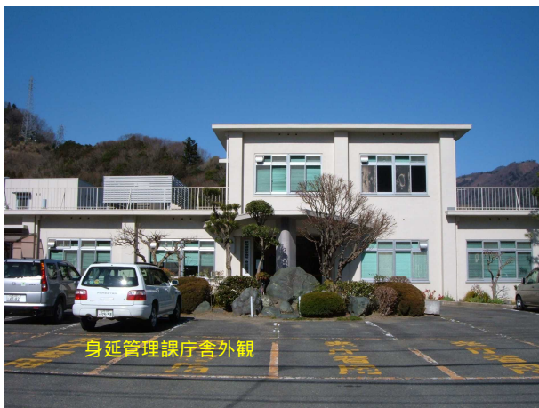
身延管理課庁舎外観

続いて、身延管理課を紹介します。身延管理課は、旧身延建設部があった建物の1階にあります。建物およびその周辺そして職場の様子を紹介します。