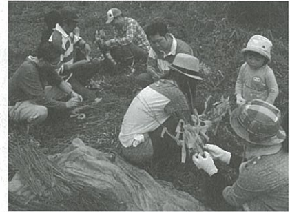
植樹苗のテープ付け

活動を続ける中で、毎年の有視界調査結果からオオムラサキが減少していることが判明し、その原因を調べたところ、オオムラサキが好む樹液を出すクヌギ林が荒廃していることが分かりました。そこで、平成20年に会をNPO法人に強化し、荒廃した雑木林のササ刈りや間伐、クヌギやエノキの植林など里山再生活動を始めました。そして平成23年からオオムラサキセンターの指定管理者になり、環