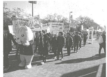
延べ80名の方が参加しました