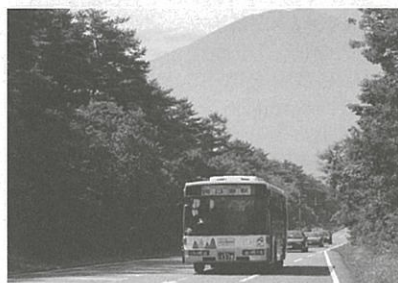
富士スバルラインを走るCNGバス

平成7年に、低公害CNG（圧縮天然ガス）バスを全国の国立公園内では初めて、富士山の麓を走る富士スバルライン、富士スカイラインへそれぞれ導入しました。また、平成28年8月に、山梨県が初めての「山の日」を記念し、両道路を通行する自動車から排出されるCO2吸収・削減の環境意識啓発を目的に行った「山の日カーボン・オフセット キャンペーン」に参加・協力しました。