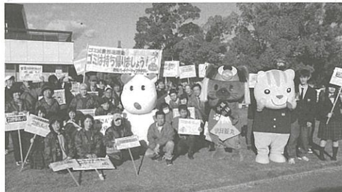
参加した皆様と記念撮影