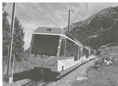
マッターホルン・ゴットアルド鉄道

当社では、定期的に職員を派遣し、環境への取り組みなどの研修を受け、人的交流・技術交流を図っています。