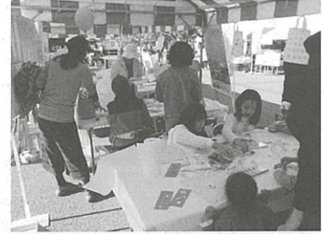
お絵かき大会の様子