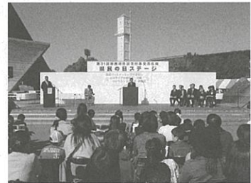
出席者が150名を超す大規模な表彰式となりました