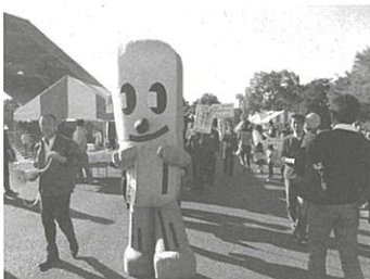
ゆるキャラにも協力してもらいました

今年は、パルシステム山梨のこんせんくん、(公社)やまなし観光推進機構の武田菱丸、山梨県のモックくん、笛吹市のフッキー、甲府昭和高校のトライスなど、多くのキャラクターもパレードに参加し、注目度も抜群でした。