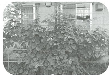
とっても元気！な葡萄のカーテン

また、園ではゴーヤの緑のカーテンも元気に頑張っています。昨年度から取り組んでいる山梨を代表する果物である葡萄のカーテンも2年目に入り写真のように立派に育ってきました。今年はブドウの収穫を期待できそう、子ども達と楽しみに収穫の日を待っています。