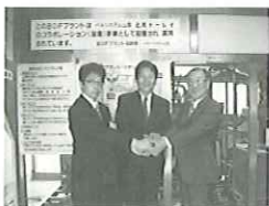
燃料精製プラント前にて

そこでパルシステム山梨でも、配送のトラックにCO 2 カウントがゼロであるバイオディーゼル燃料を積極的に使用しています。2009年度は20台の車輛に合計53,432ℓを給油、軽油換算で140,205kg-CO 2 の二酸化炭素を削減する事ができました。