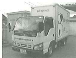
バイオディーゼル燃料使用車

2010年4月からは株式会社トーレイとのコラボレーション事業として、さらに地域にオープンな事業として進めていきたいと考えています。ぜひ皆様も回収や利用にご参加いただき、山梨で循環するエネルギーでCO 2 を削減する、このバイオディーゼル燃料事業を一緒に育ててください。