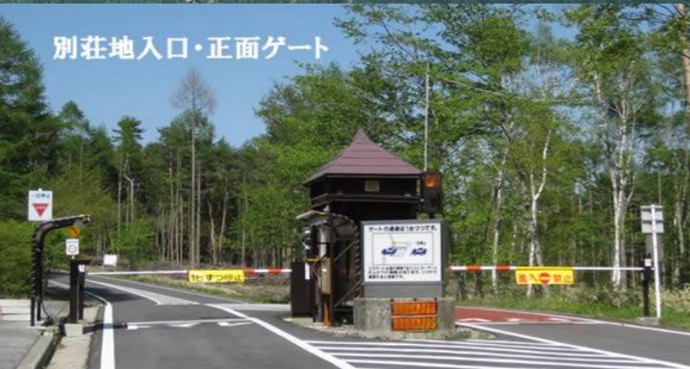
別荘地入口・正面ゲート