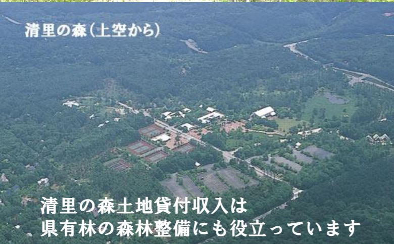
清里の森(上空から)