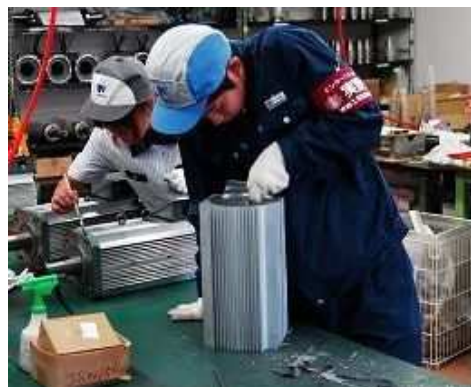
モーターの組み立て作業です（甲府工業高校）

北杜市の精密機器メーカーの工場では甲府工業高校電気科の生徒が製品検査の手伝いをしていました。早速感想を聞くと、「いくつかの工程を見せてもらいました。仕事に対する厳密さはすごい。進路希望はこうした電機関係の分野への就職です」また別の生徒は、「大学進学を考えているけど、いずれはこの会社みたいなところで働きたいです。労務についての規程とか法律のことはここで初めて聞きました」とのことです。来てよかったという感じでした。