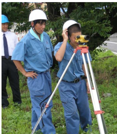
道路工事の測量（農林高校）

真夏の太陽が照りつける道路工事現場で農林高校環境土木科の生徒二人は、レベルを覗いていました。側溝の高さを決めるためです。感想を聞いてみると、「暑いですが」といいながらも、「やっぱりプロの作業はテキパキとしているのですね。現場に出てみて仕事がおもしろいです。将来はこうした仕事につきたいです」と手応えを感じている様子でした。