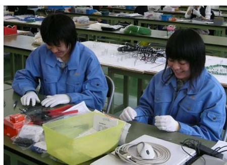
工作機械制御装置のコードです（荊崎工業高校）

インターンシップは、生徒が職業を考えるいい機会になっています。生徒が、表面的な理解で職業選択をすることは危険です。インターンシップにより、現場を体験してみてその実際のところや自分の適性を理解して的確な職業選択をしてほしいですね」