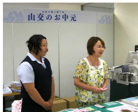
接客の様子を観察（北杜高校）

インターンシップの実施では企業などの事業所の協力が不可欠です。昨年からの経済情勢の変化で、各企業は必ずしも余裕がある状態ではないと推測されます。そのなかで各協力事業所は、生徒を受け入れて指導をしてくれています。また山梨県中小企業団体中央会をはじめとする多くの企業団体、厚生労働省山梨労働局のもとにあるハローワークも就労場所の確保で協力をしてくれています。