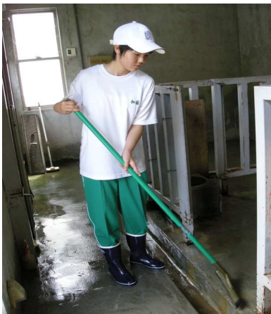
飼育舎を清潔に（甲府城西高校）

例えば動物と接する体験も出来ます。今年度は動物園が選択肢に入りました。訪ねてみたところ、見学コースからは見えない飼育舎裏手で黙々と清掃をする姿が見られました。彼女は自ら動物園での体験を選択して積極的に行動していました。