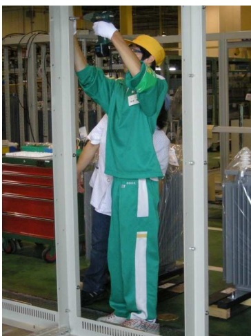
受変電設備を組み立てています（白根高校）

インターンシップは、専門高校では専門分野の実習としての意味もありますが、普通科高校でも重要な役割を果たしています。