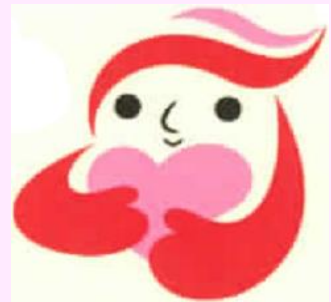
犯罪被害者等支援 シンボルマーク 「ギュっとちゃん」