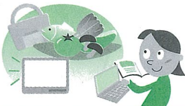
通信販売等での商品の購入