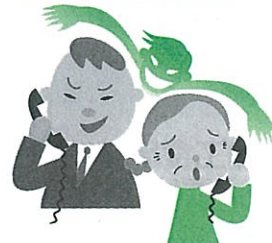
見知らぬ事業者が～