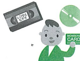
レンタルビデオ店への入会