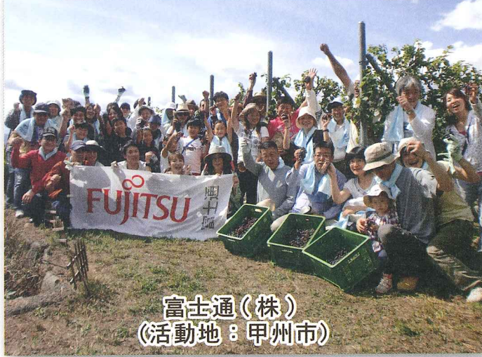
富士通(株) (活動地：甲州市)