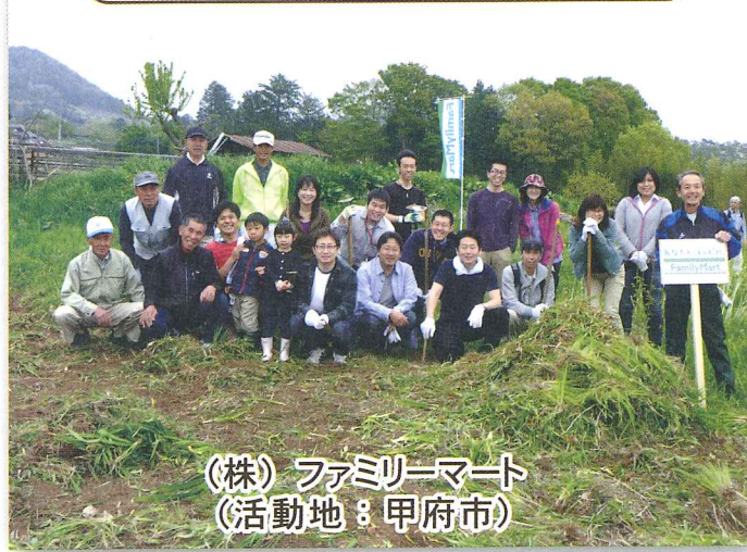
(株)ファミリーマート (活動地：甲府市)