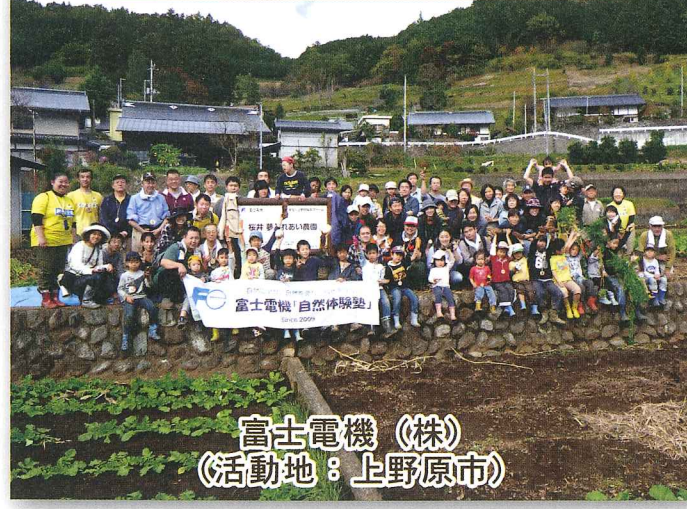
富士電機(株) (活動地：上野原市)