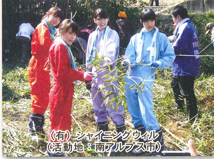
(有)シャイニングウイル (活動地：南アルプス市)