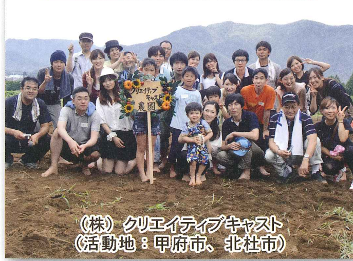
(株)クリエイティブキャスト (活動地：甲府市、北杜市)