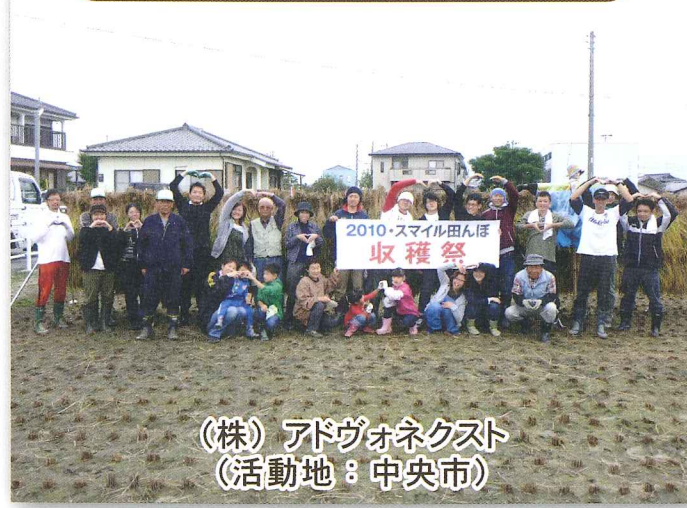
(株)アドヴォネクト (活動地：中央市)